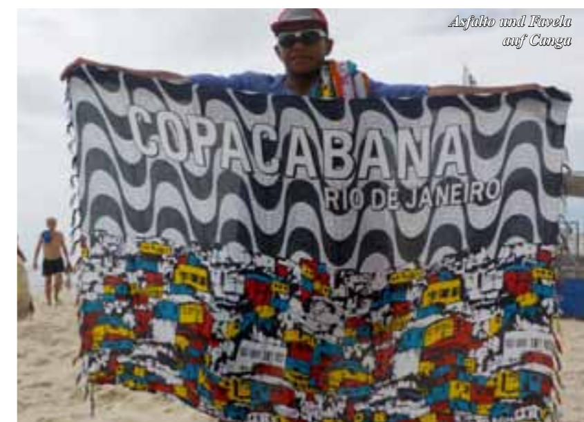
Asfalto und Favela auf Canga